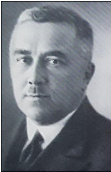
عکس نیکلای مارکوف معمار ساختمان میراثی پروین اعتصامی

بنا نیز به صورت لچکی و کتیبه‌ای اجرا شده است. سطح نمای اصلی نیز کاملاً صاف است و عمق و بعد در آن دیده نمی‌شود. در دهه ۱۳۹۰ خورشیدی این اثر تاریخی توسط استاد اکبر تقی‌زاده اصل مورد مرمت و استحکام‌بخشی قرار گرفت.